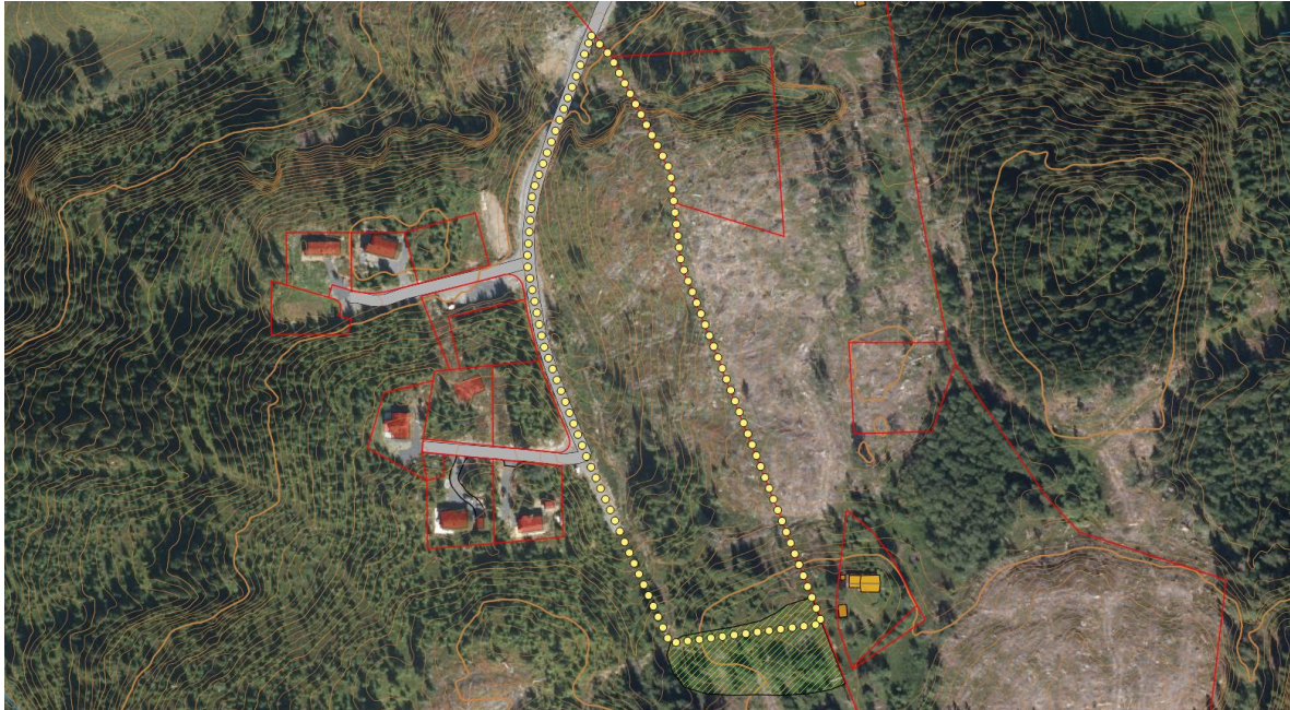
Figur 3. Undersøkellesområde i gult og den grønne skravuren gjelder det kompensierende arealet.