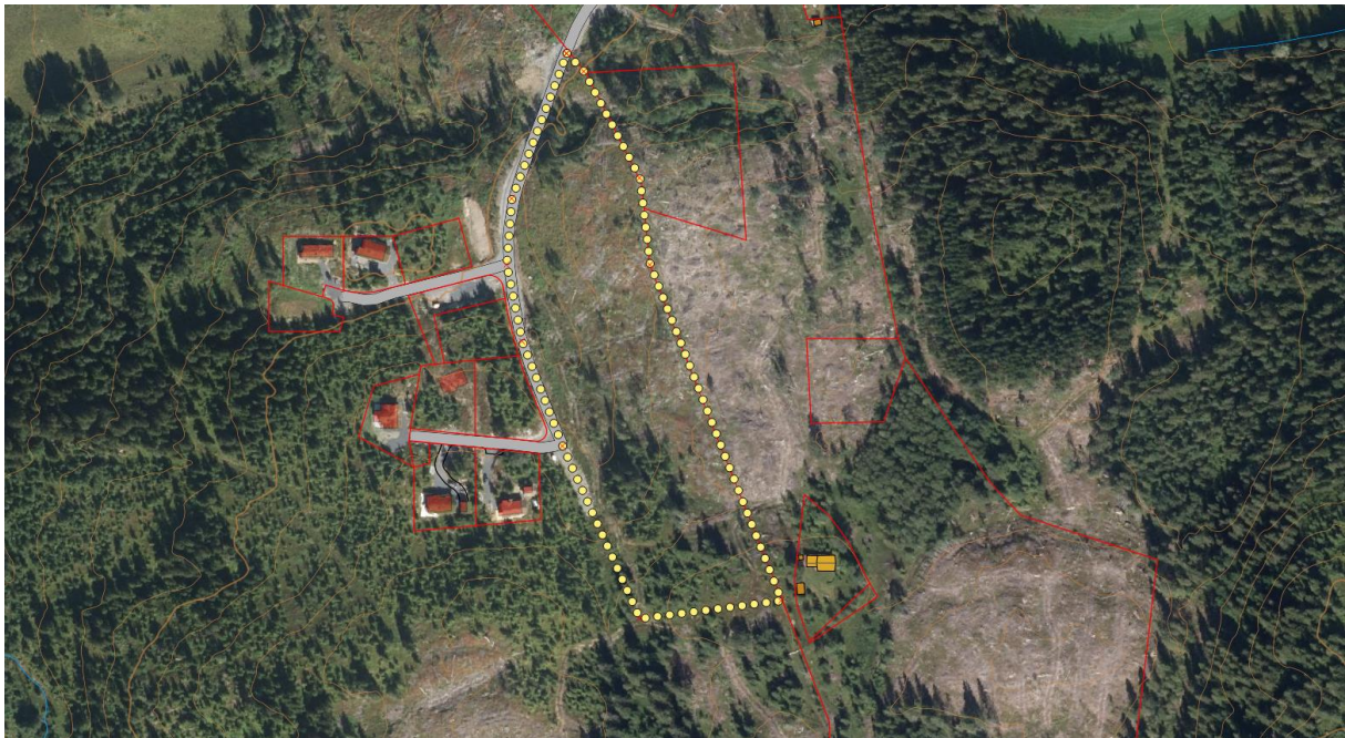
Figur 1. Undersøkelsesområde (gult) ved Lindstadutsikten i Lunner kommune.

Kartlegging av naturtypelokaliteter følger DN-håndbok 13, revidert utgave (Direktoratet for Naturforvaltning 2007). Det henvises til denne, og da spesielt kapitlene 2-6, for en nærmere redegjørelse av kriterier for utvalgelse av naturtyper og verdisetting. BioFokus bruker faglig skjønn for å avveie hvor detaljerte undersøkelsene trenger å være. Vi bruker vår kunnskap om arter og økologiske sammenhenger ved avgrensning og verdisetting av naturtyper. Området ble kartlagt for utvalgte/prioriterte naturtyper, rødlistearter, svartelistearter og andre naturverdier. Naturbase (Miljødirektoratet 2016) og Artskart (Artsdatabanken & GBIF Norge 2016) ble konsultert for informasjon om tidligere registrerte naturtyper og eventuelle funn av rødlistearter i området. Målet med undersøkelsen var å påvise og beskrive eventuelle naturverdier innenfor undersøkelsesområdet.