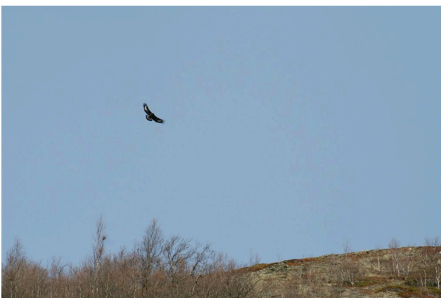
Jaktende kongeørn ved Øyasætri.