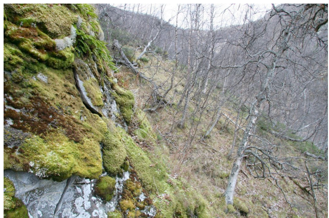
Lavfloraen på bergvegger er stedvis ganske rik i bjørkeskogen. Her bergvegg med praktlav ( Cetrelia olivetorum ) (VU).