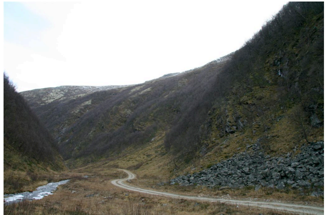
Midtre deler av Øyadalen, med fuktige bjørkeskogsmiljøer i de bratte, nordvendte dalsidene.