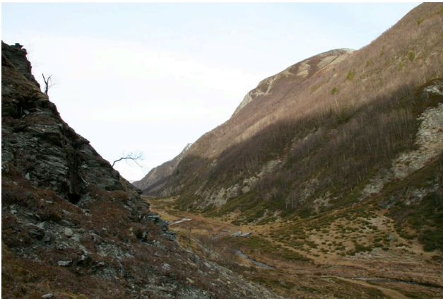
Øyadalen er en fjelldal, med glissen bjørkeskog i dalsidene, beitemark i dalbunnen og bratte skrenter opp mot fjellet.