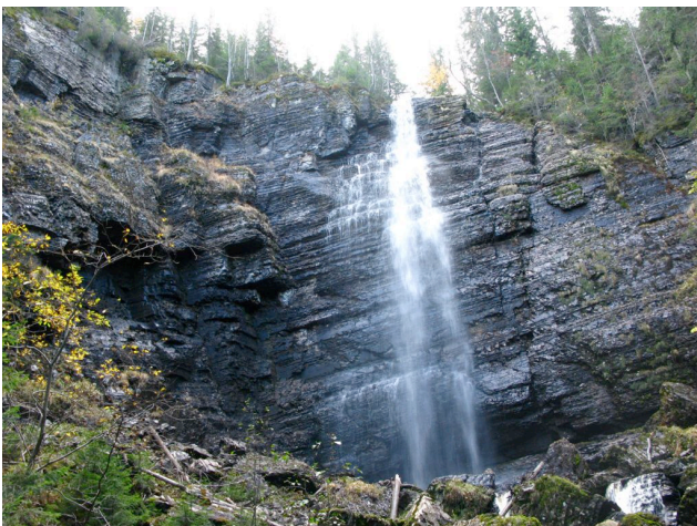
Øverst i lokaliteten faller en høy foss ned over kalkbergene.