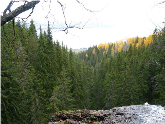
Askerudelva danner ei markert nordvendt bekkekløft som faller bratt ut mot Tyrifjorden.