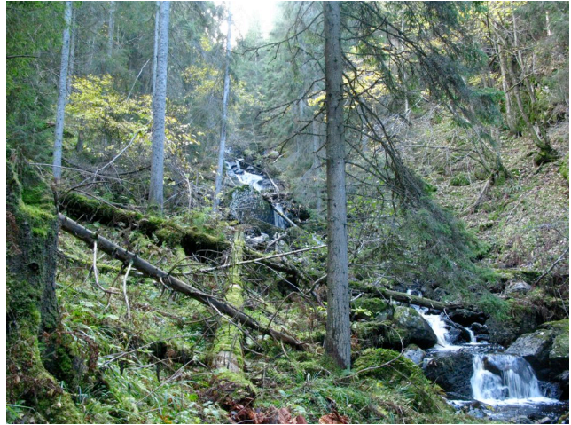
Fuktig bekkekløftskog med mye læger i midtre del.