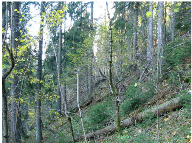
Gammel lågurtskog i nedre del.