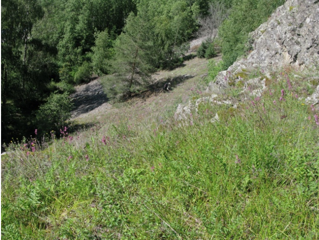
Øvre del av den åpne tørrengen nedenfor Stordalsberget, fotografert i 2011.