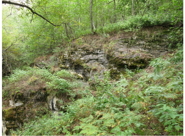
Nordvestre del av kjerneområde 2, med innslag av høystaudevegetasjon.