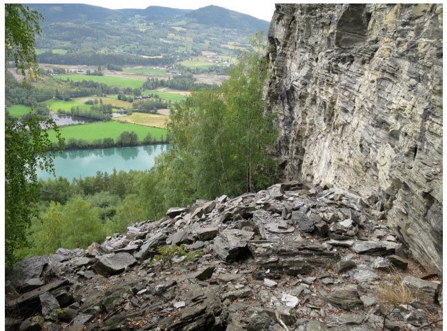
Bergveggen og øvre del av rasmarken ved Stordalsberget i kjerneområde 1.