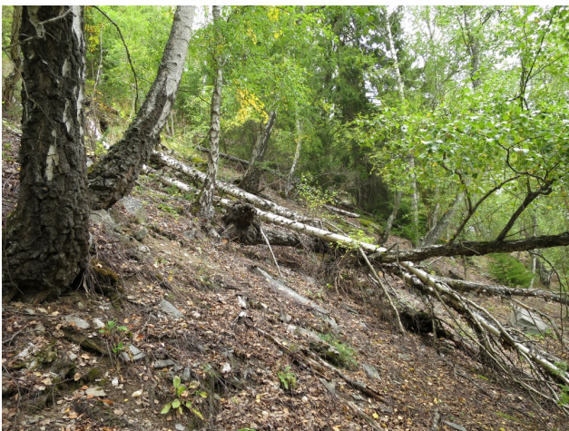
Gammel bjørkeskog i noe finkornet rasmarken i kjerneområde 2.