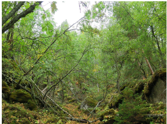
Lengst sør i Angardslie (kjerne 9) er det krongleterreng med rik gammel lauvskog og mye rike berg med velutviklede lungeneversamfunn.