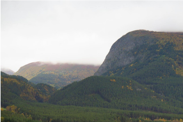
Nonshaugen står som en bauta ved inngangen til Jønndalen, med Kollen foran og Musbekken-Ilkas kløft til venstre.