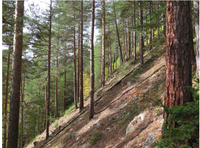
Brattskrentene langs Musbekken-Ilka (kjerne 6) har ekstremtørr kalk-sandfuruskog, stedvis med gamle trær. Voksested for blekkstorpigg ( Sarcodon fuligineoviolaceus ).