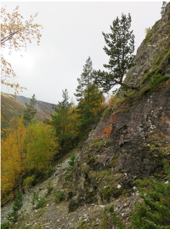
Jønndalsberget sørskrent (k1) har åpne kalkberg og kalkskrenter med en svært rik lavflora i steppe-elementet.